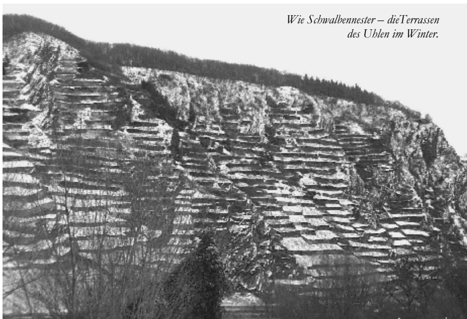
Wie Schwalbennester – die Terrassen des Uhlen im Winter.

»Freundschaft auch der Menschenwesen, Transparenz, von Blüten ein Überschwang ...« sagt Pablo Neruda.